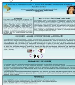
Figura 1. Cartel digital Eytza Corredores.

Así de esta manera en todos los cursos precisaron su agrado ante todo lo compartido. De igual forma se puede observar un producto del diplomado en la figura 1. Cartel digital Eytza Corredores