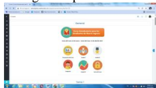
Figura 1. Aula virtual iconográfica para el curso de inducción.

Así de esta manera a lo largo del curso precisaron su agrado ante todo lo compartido. De igual forma se puede observar el aula iconográfica en la figura 1. Aula virtual iconográfica para el curso de inducción